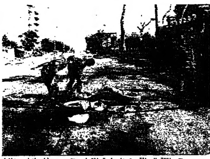
طريق الطيبة بعد فتحها - (محمود الطويل)